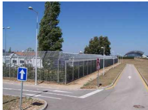
A gauche : Centre de rétention. Tout droit : Aéroport de Lyon

FORTE MOBILISATION LOCALE POUR EXIGER SA LIBERATION.