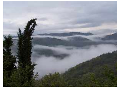
la pluie tant attendue en Ardèche s'est arrêtée...