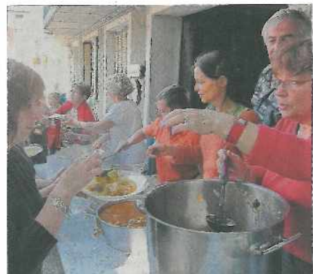
Ambiance conviviale ce dimanche soir place de l'horloge, autour d'un couscous géant.

Dimanche, la fête s'est poursuivie tard, avec la participation d'un groupe musical : quintet, jazz latin. □